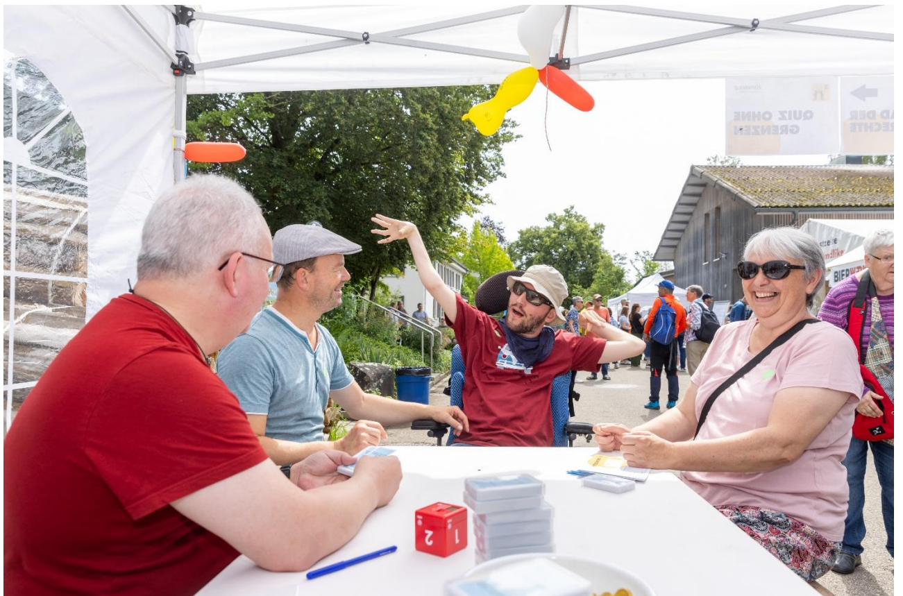
Die Stimmung war bombastisch: Strahlende Gesichter, wohin man blickte.